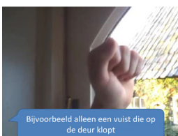
Bijvoorbeeld alleen een vuist die op de deur klopt